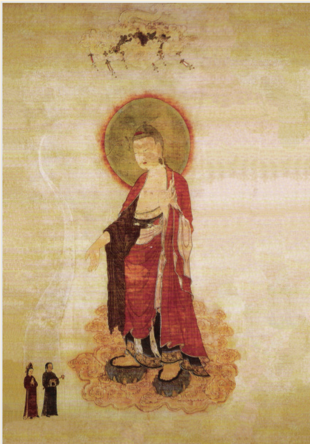
阿彌陀佛接引圖·西夏·佚名