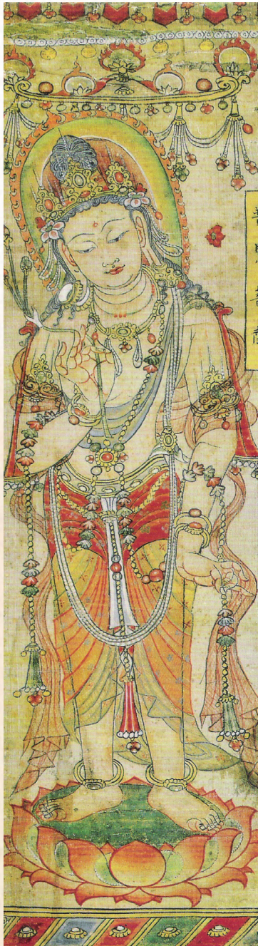
普賢菩薩像·唐·佚名

我 今 見 聞 得 受 持 ， 願 解 如 來 真 實 義 。 wǒ jīn jiàn wén dé shòu chí , yuàn jiě rú lái zhēn shí yì 。 無 上 甚 深 微 妙 法 ， 百 千 萬 劫 難 遭 遇 。 wú shàng shèn shēn wēi miào fǎ , bǎi qiān wàn jié nán zāo yù 。