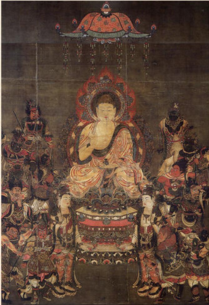
藥師三尊與十二神將·十三世紀