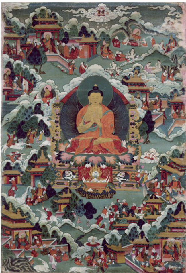
釋迦加持圖·十九世紀·西藏唐卡