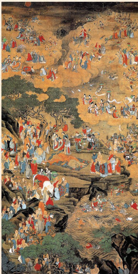
釋迦涅槃圖·明·吳彬

佛陀將要入涅槃的時候，曾再三囑咐諸比丘：「依四念處住，如佛無異。」如今正遭逢末法時期，很少見到有正念的學佛人。縱然遇到這個法門，又能有幾個肯去修學的呢？不但不去思悟其中的真義，而且連這最根本的名詞術語都搞不明白，實在是太可悲啦！我閑居無事，讀《涅槃經·遺教品》，取其中大義作成詩頌，借助音律，使詠唱者正念增長，妄心息滅。也可抄錄在案頭座邊，每天用來自警的同時，還能夠不忘佛陀的遺誡。