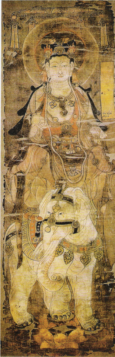
普賢菩薩立像·唐·佚名

我 今 見 聞 得 受 持 ， 願 解 如 來 真 實 義 。 無 上 甚 深 微 妙 法 ， 百 千 萬 劫 難 遭 遇 。